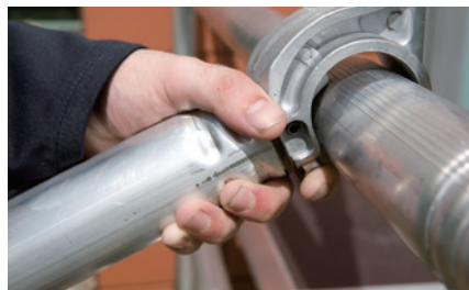
ブレース(筋交)のフックはワンタッチ式ロック付です。先端は衝撃に強い形状です。