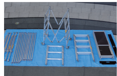
3段(5.3m)タワーの部材一式。