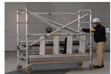
各部材はベース内に収納でき、このままハンドリングOK。

◀本体搬送時のキャスターは軸に対して偏心しておりハンドリングが軽快です。ロックすると直軸となり垂直荷重をしっかりと受けとめます(ブレーキ性能170kg)。