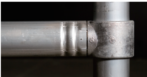
加締による圧着は溶接の数倍の強度を誇ります。

※幅 / 長さの数値は、パイプ芯々間の寸法です。※作業床積載荷重は床板1枚あたり260kgです。※オプションで8fタイプもございます。 ※仕様は予告なく変更することもございますのでご了承ください。