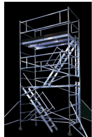
ステアウェイ(階段)付仕様もあります。