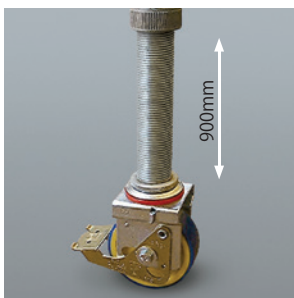
レッグは最大900mmまで伸び、段差に対応ができます。